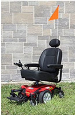
Fauteuil roulant motorisé